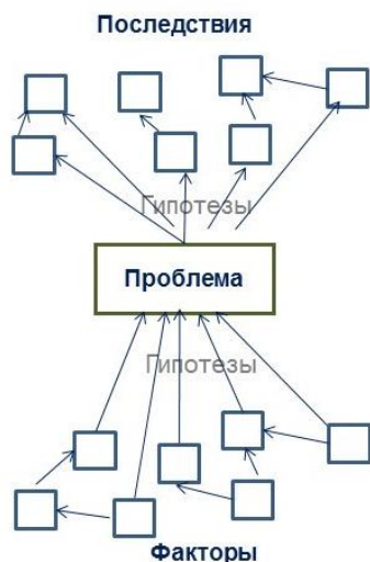
Рисунок 1. – Модель проблемы

Таим образом, модель программы будет выглядеть примерно как на рисунке, ее еще называют «деревом проблем» (рис. 1).